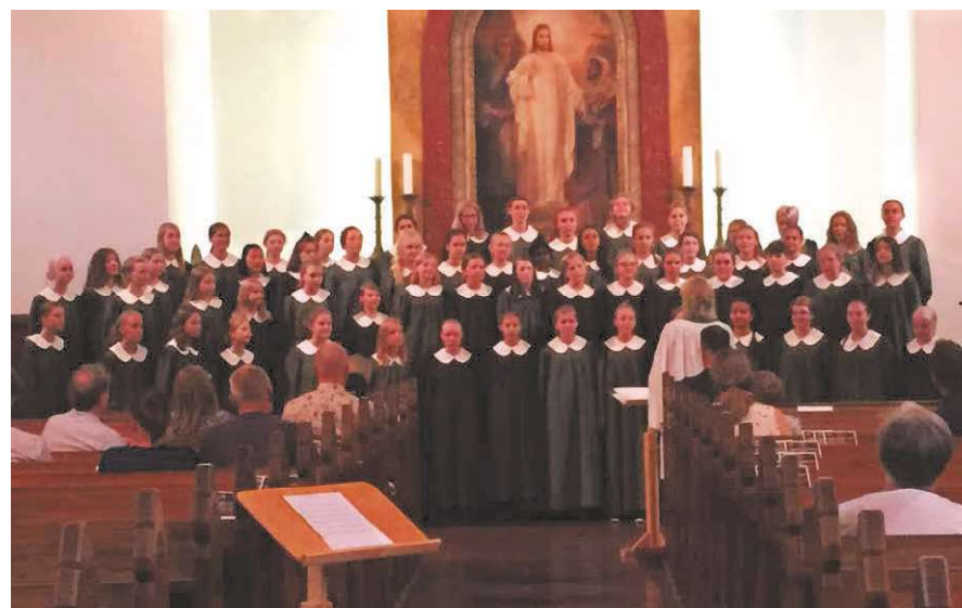
Június 19-én az uppsalai dóm lánykórusa volt a vendégünk