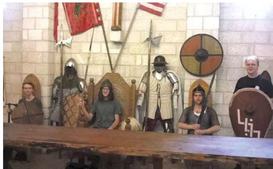
Ifiseink a szigethalmi Emese-parkban